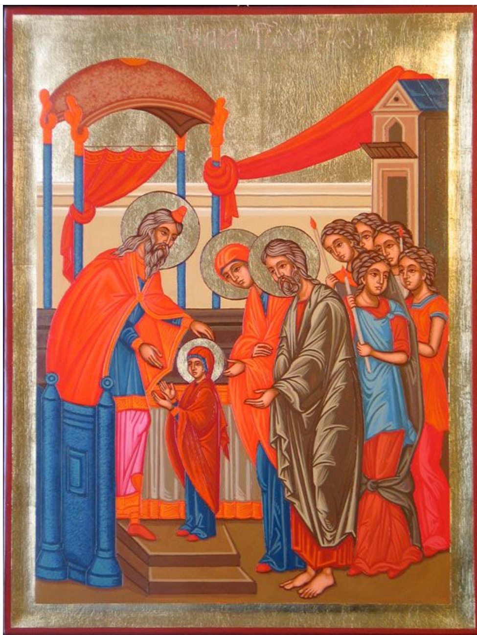
Presentación de la Madre de Dios al Templo (Tudorache-Dicu Aurel)

“Nos guíe y asista la Virgen María presentada al templo... ...sin duda que es una imagen muy cercana a la dinámica formativa. Entrar en el templo para salir hecha Templo viviente de Aquél que habita en el Templo”