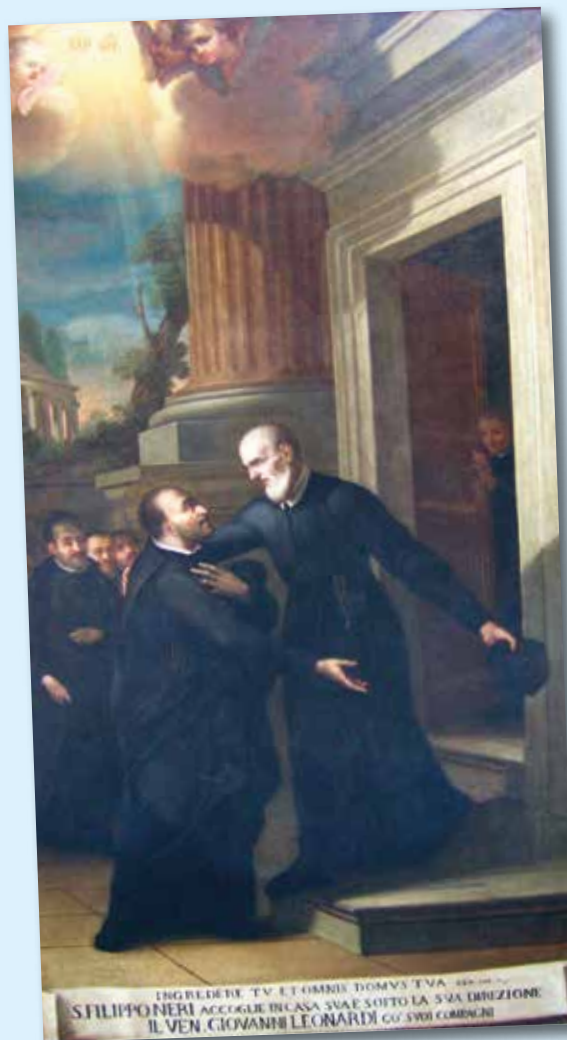
S. Giovanni Leonardi accolto da S. Filippo Neri (XVIII sec.). Convento di S. M. in Campitelli

Beata Ludovica Albertoni, S. Ignazio di Loyola e San Francesco Saverio, S. Filippo Neri, S. Giovanni Leonardi, S. Giuseppe Calasanzio e il Beato Pietro Casani che fu fra i Chierici del Leonardi e poi passò agli Scolopi, S. Luigi Gonzaga che servì gli appestati nell'Ospedale di S. Maria in Portico poi della Consolazione e lì volò al cielo; S. Giovanni Battista de Rossi e la Beata Margherita di Savoia appartenenti alla Compagnia di S. Maria in Portico, Sant'Eugenio Mazenod, San Gaspare del Bufalo, San Giovanni Bosco, San Massimiliano Kolbe, San Gaetano Errico.