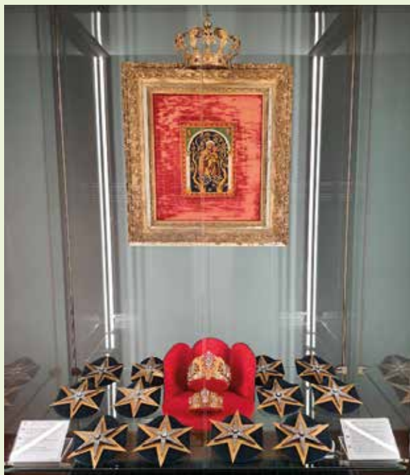
Museo del Tesoro di S. Pietro in Vaticano

Nella descrizione della Basilica Costantiniana di San Pietro del gesui-