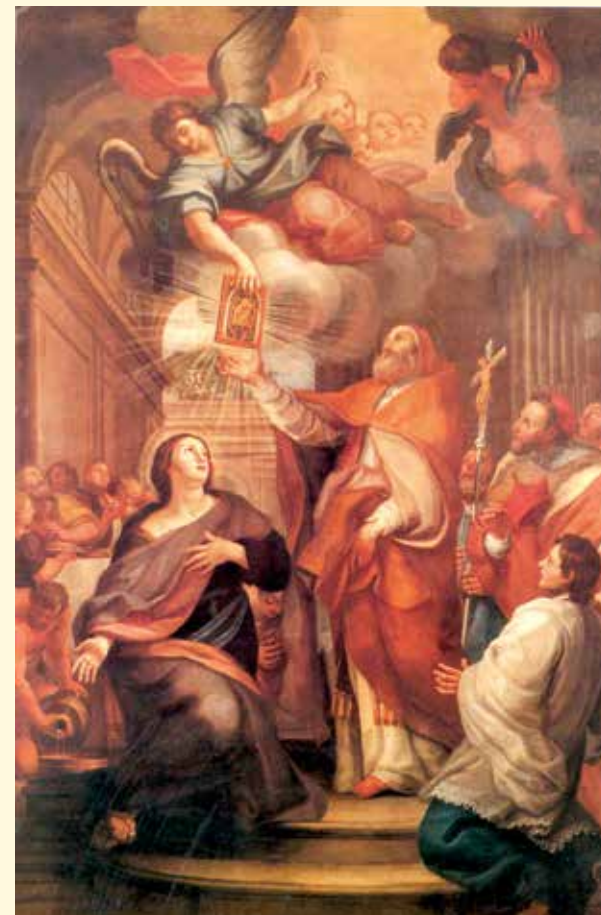
La celeste effigie di Maria appare a Santa Galla e Giovanni I. Roma, Chiesa di S. Galla

Un distico rimato del XI secolo segnalava ai pellegrini il luogo del prodigio con queste parole: “Qui è l'immagine della Madre di Dio che appare a Galla mentre timorosa serviva i poveri”. Continua il suggestivo racconto trasmesso in una Narrazione raccolta da San Giovanni Leonardi: “La nobile Galla, volle che fosse il pontefice Giovanni I ad interpretare il senso di quella luce celeste, il quale accorse con il popolo di Dio e vi riconobbe il segno di predilezione della Madre di Gesù per la città di Roma”. Da allora il luogo della celeste manife-