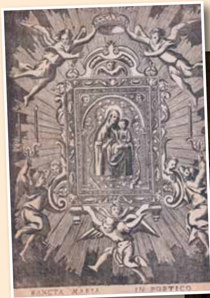
Santa Maria in Portico, stampa del XVIII sec.

Roma, piazza Montanara (Santa Maria in Portico vecchia)