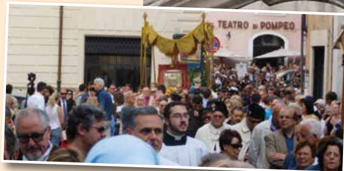
La Madonnella votiva in via Puccini a Roma; l'effigie di Santa Maria in Portico portata in processione per le strade del centro di Roma