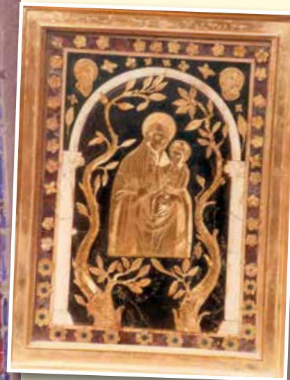
Icona del XVII sec. Chiesa S. M. in Portico a Chiaia (Napoli)

Fu eseguita una copia dell'icona in oro e il 17 luglio del 1638 si espose alla venerazione dei fedeli. In Spagna nel 1656 Re Filippo III fece ricamare l'icona in una preziosa tela di seta e la custodì nella cappella di Corte. A Latera (Viterbo) nella metà del XVII secolo la Serva di Dio Camilla Virginia Savelli Farnese fece riprodurre una copia dell'immagine ed edificò una cappella.