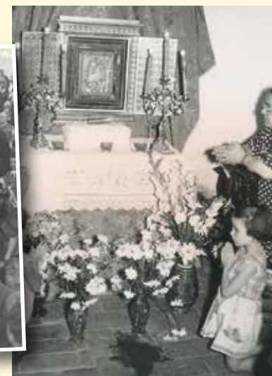
La prodigiosa icona viene tralata nella Basilica di San Pietro e venerata per alcuni giorni (1924)