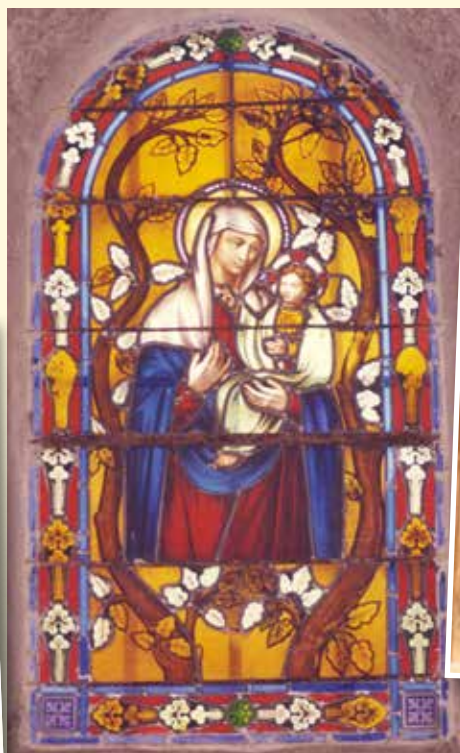
Vetrata del Santuario di Onoz (Francia)