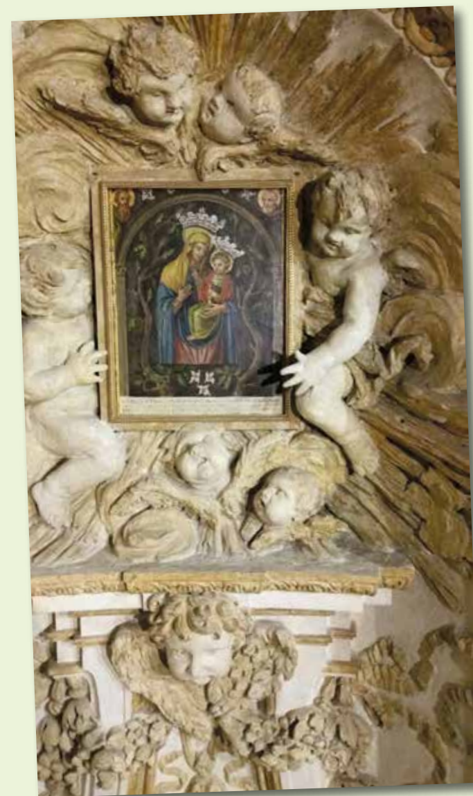
Roma. Monastero dei Sette Dolori, Tempietto del Borromini

Nel 1899 dopo la seconda incoronazione dell'immagine di Santa Maria in Portico, i canonici del Capitolo Vaticano collocarono una copia dell'effigie oggi custodita nel Museo di San Pietro.