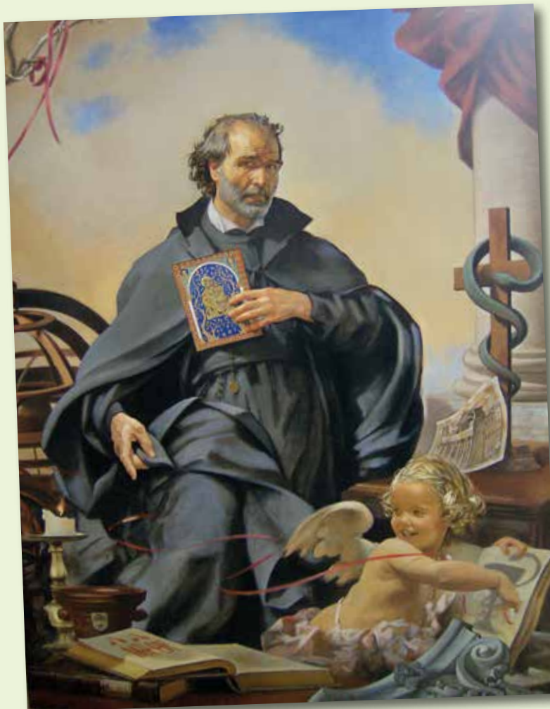
Chiesa di S. Lorenzo in Miranda, Roma

Nel 1662 dopo la costruzione della nuova Chiesa di Santa Maria in Campitelli, Papa Alessandro VII ordinò che l'icona fosse traslata insieme alle spoglie del Santo fondatore, sepolte sul lato sinistro dell'altare maggiore di Campitelli.